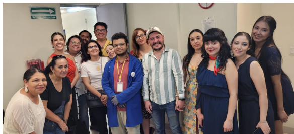
Encuentro de portadores 10 de junio 2024