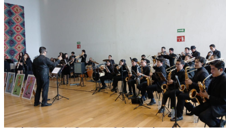
BigBand CNM, 30 de junio