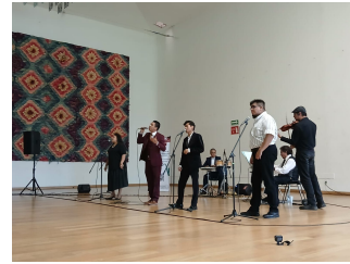
Tarde de Boleros 28 de julio