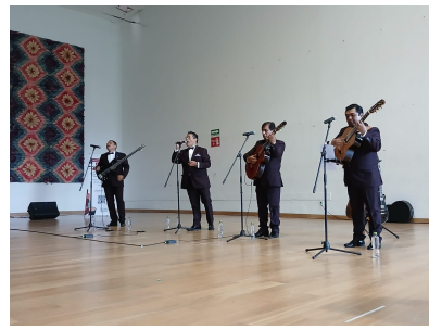
En. Canto, 27 de octubre