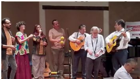
Encuentro de portadores 13 de mayo 2024