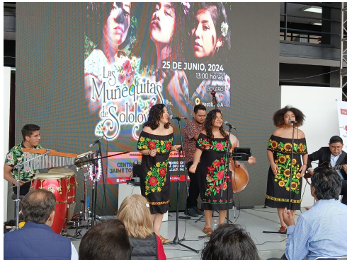
Muñequitas de sololá, 25 de junio