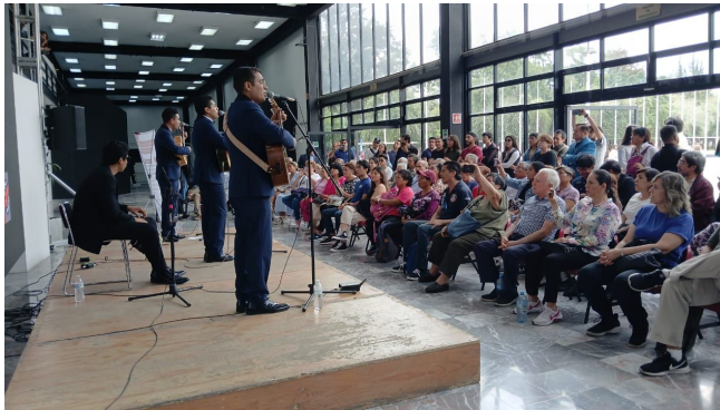
Herederos del Bolero, 9 de julio