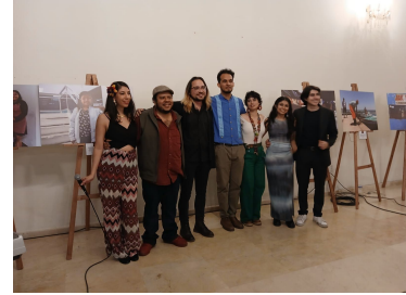
Ganadores Nimbeë, 25 de agosto