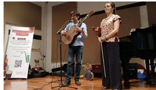
Encuentro de portadores 8 de julio 2024