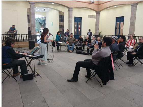
Encuentro de boleristas 27 de febrero 2025